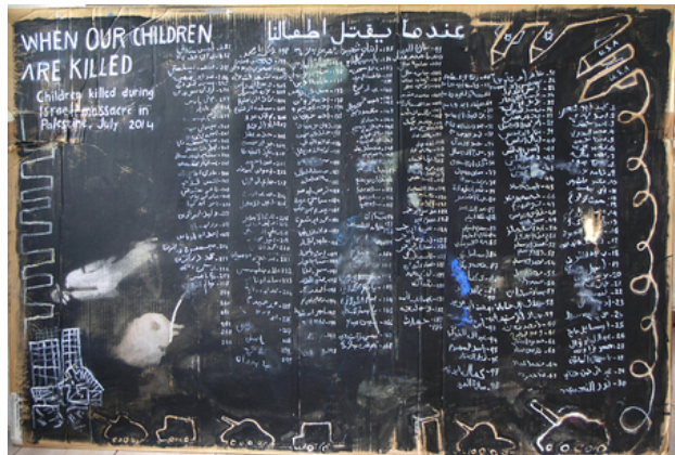
Mural Westbank, 2019 gem.techn., 120 x 90 cm