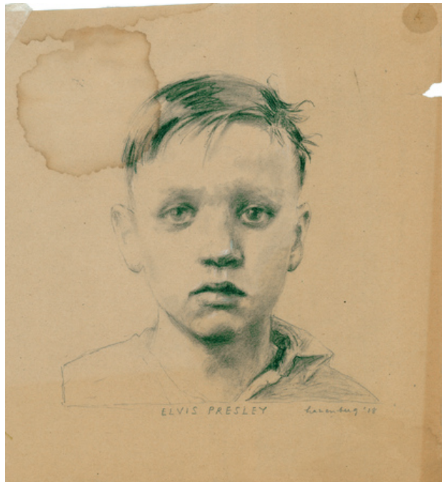
Elvis Presley, 2018 houtschool/conté, 15 x 20 cm