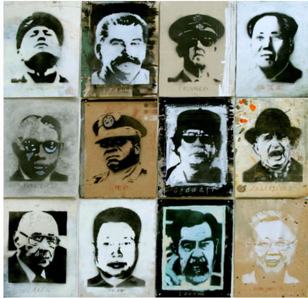
Scary Men, 2019 spuitbus, 100 x 100