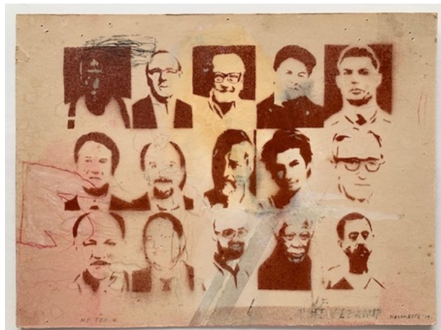
Me Too 2, 2019 spuitbus, 30 x 40 cm