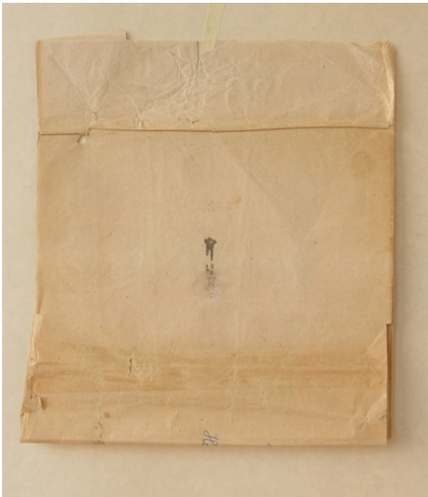
natuurijs, 2019 spuitbus, 18 x 22 cm