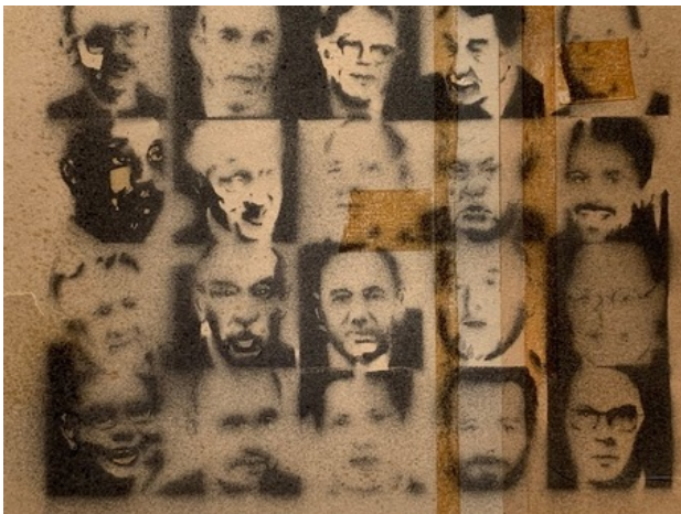
Me Too, 2019 spuitbus, 30 x 40 cm