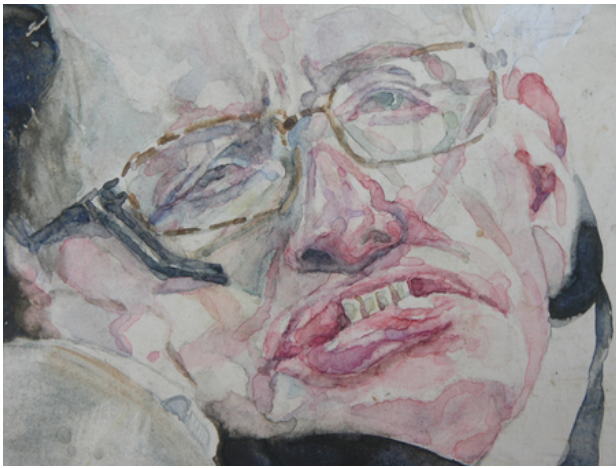
Stephen Hawking, 2019 aquarel, 22 x 18 cm