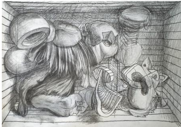
, 2021 potlood op papier, A3