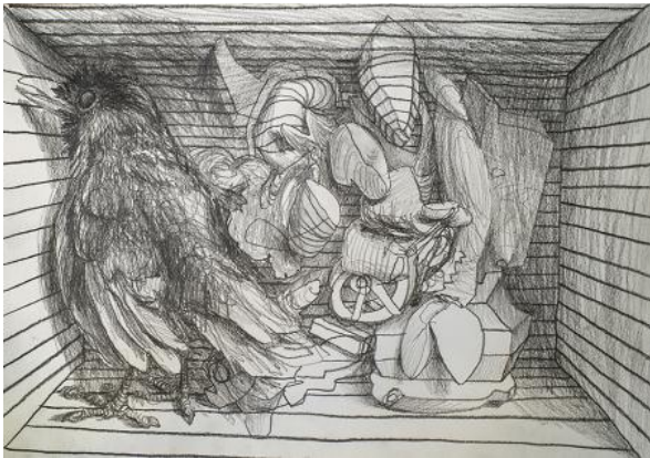
, 2021 potlood op papier, A3