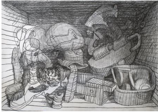
, 2021 potlood p papier, A3