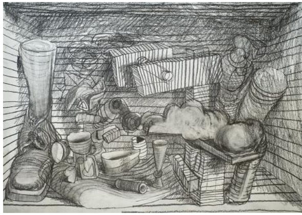
, 2021 potlood op papier, A3