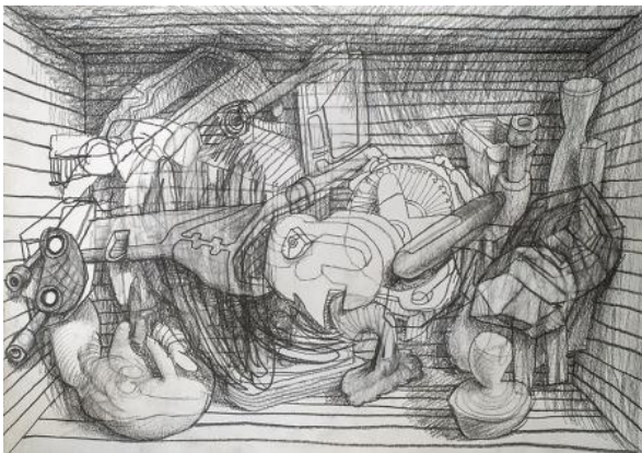
, 2021 potlood op papier, A3