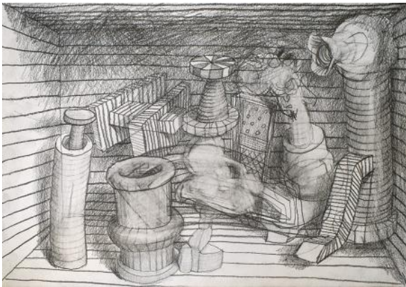
, 2021 potlood op papier, A3