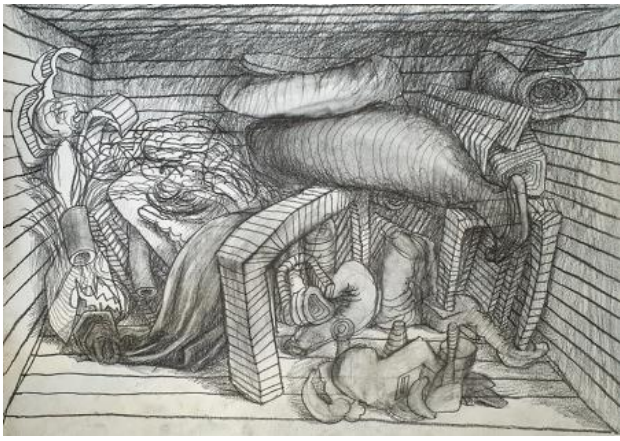
, 2021 potlood op papier, A3