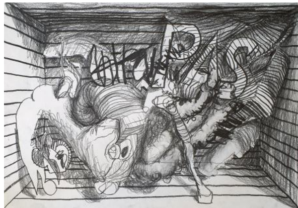
, 2021 potlood op papier, A3