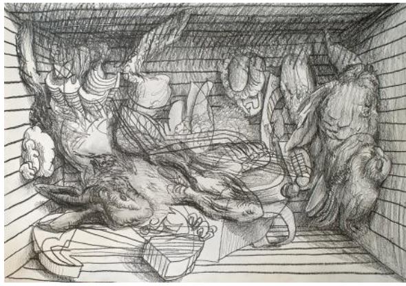
, 2021 potlood op papier, A3