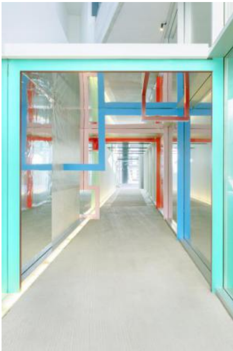
installatie Isomatrix, 2021 various, 12 x 5 x 4 m