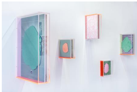
Ongoing Series of False Ceilings, 2023 False, ceiling, Gyps, photoprints, wood and plexiglass, divers