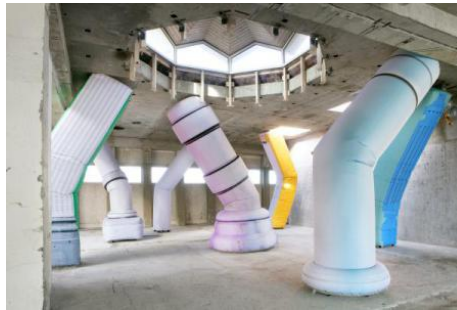
Installation view Big Art, 2022 Fotoprint op doek, 600 x 700 x 400 cm