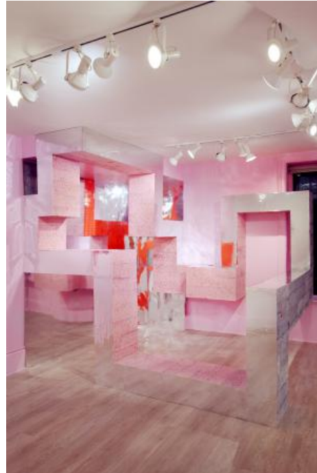
Radical Interventions, 2023 photoprints and cardboard, 5 x 5 x 8 meter