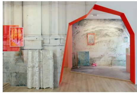
In Situ, 2023 divers, exhibition view