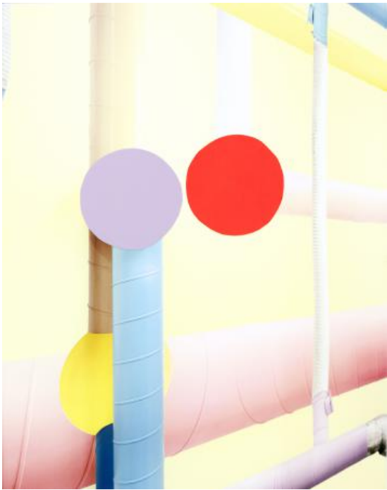
Interior no. 66, 2022 Ultrachromeprint met plastic folie, 32 x 40 cm