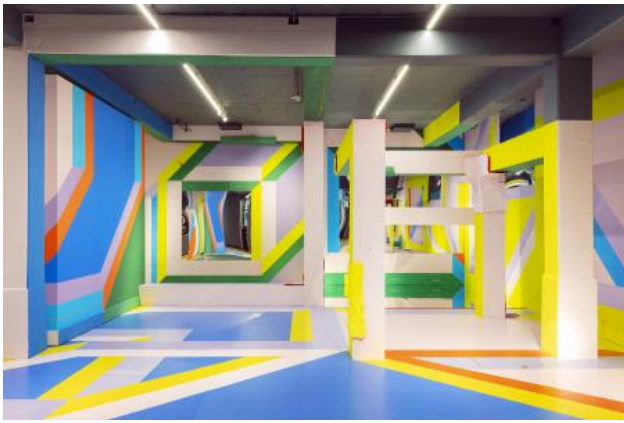
Installation view Enter the Cube, 2025