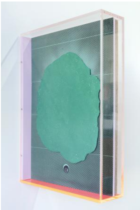
Ongoing Series of False Ceilings no. 3, 2023 plaster, False ciling plates, wood, photoprints and plexiglass, 42 x 60 x 12 cm