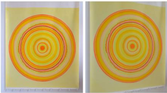
Like Earth; warm up a few degrees and let your ice ..., 2025 olie-pastel op papier, 157 x 170 cm

2016 - Bestuurslid SW2 (Kunstenaars stichting 2019 betaalbare ateliers)