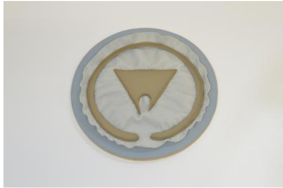
Yield S 06, 2020 klei, vilt, mdf, linoleum., 31,5 x 31,5 x 4,5 cm.