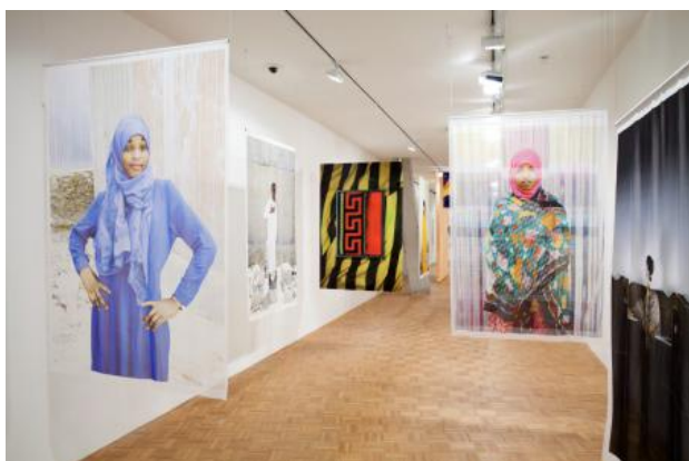
Ode to Youthfull Daredevils, 2019 Installatie zijden, 4 x 12 mtr