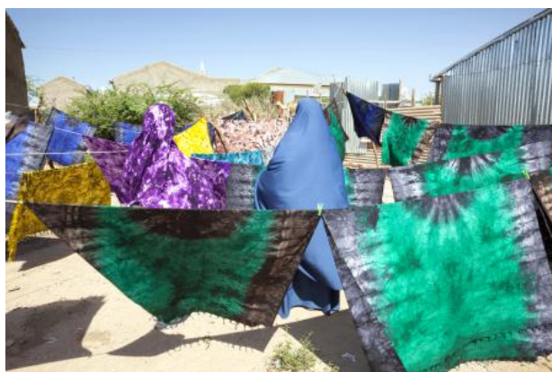
Women's cooperative, 2018