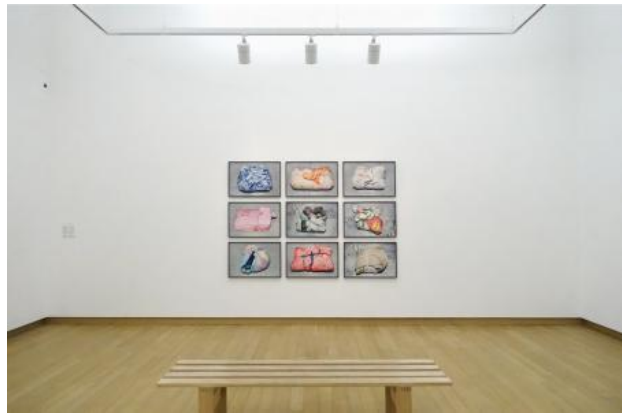
The Floating Population, 2018