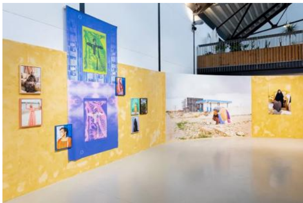
People Made of Stories, 2025 Installatie, fotografie, textiel