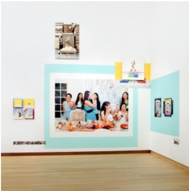
A Nation Outside A Nation, 2015 verschillende, 4x7