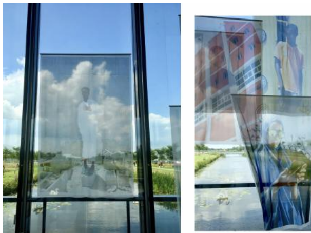
Ode to Youthfull Daredevils, 2020 Installatie zijden, 4 x 12 mtr