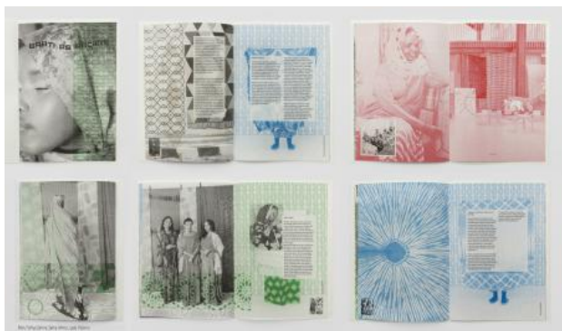
Baati as Archive, 2025 zine