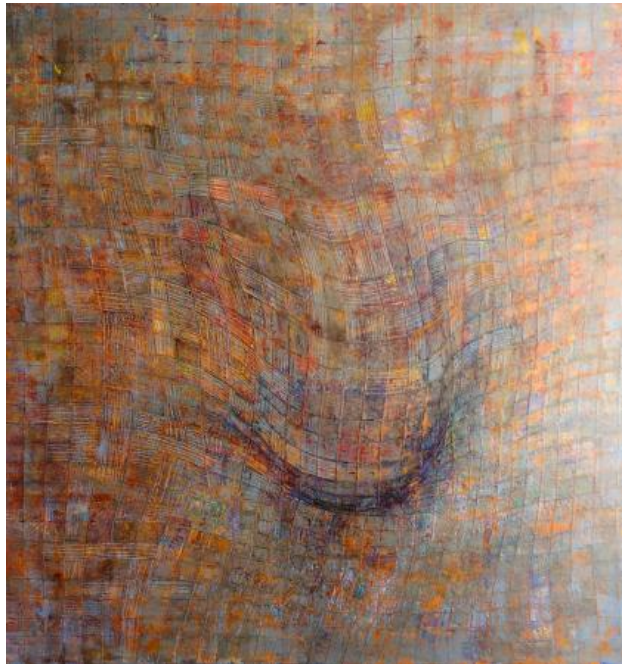
imapct03, 2020 olie op doek, 2mx2m