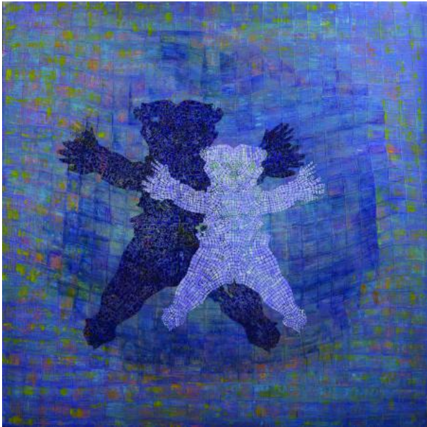
Knuffel, 2022 Oil on doek, 200x200x10cm