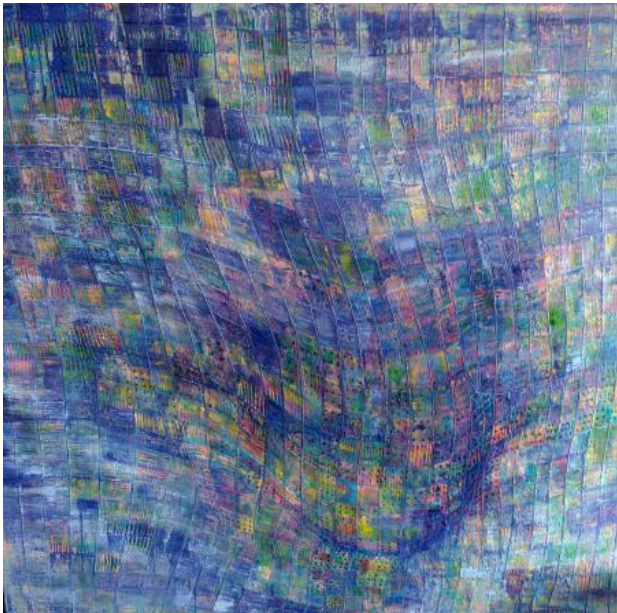
imapct01, 2020 olie op doek, 2mx2m