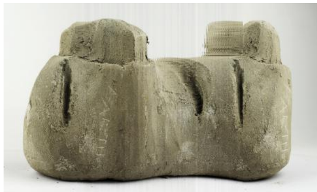
EARTH, 2022 kleiwerk en fotografie