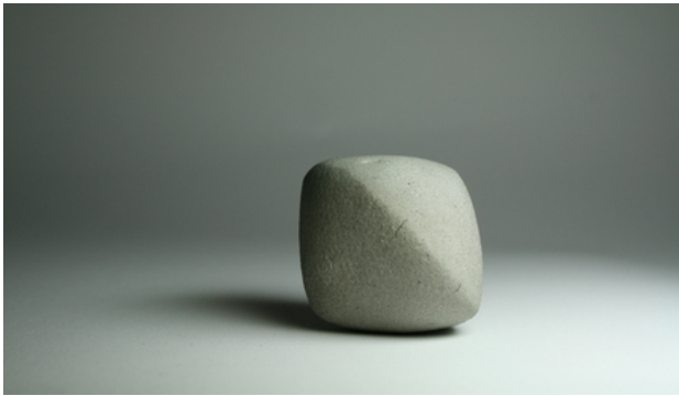
still leven, 2019