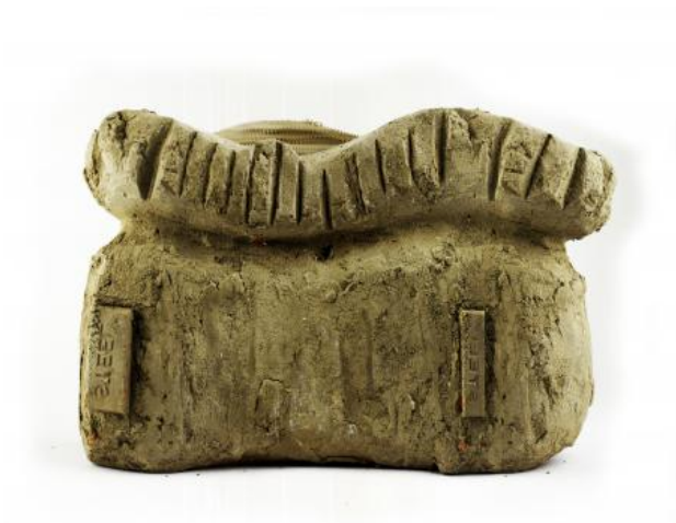
staal, 2022 kleiwerk en fotografie