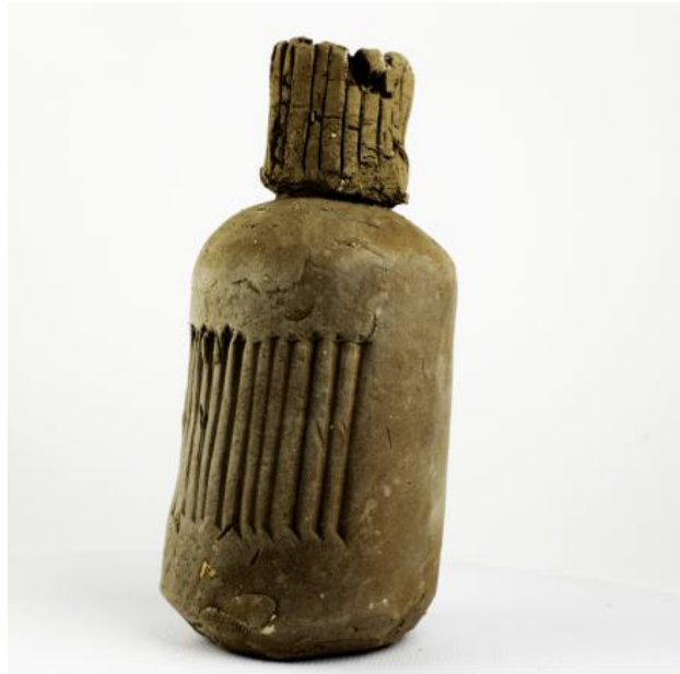
aarde, 2022 aarde, 4cmx4cmx9cm