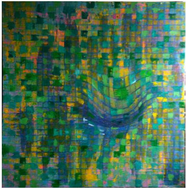
imapct02, 2020 olie op doek, 2mx2m