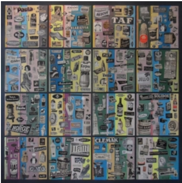
ARTvertising 4, 2015 Acryl/collage op paneel, 100 x 100