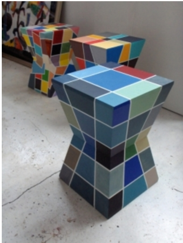
Diabolo, 2010 Acrylic on wood, 40 x 40 x 70