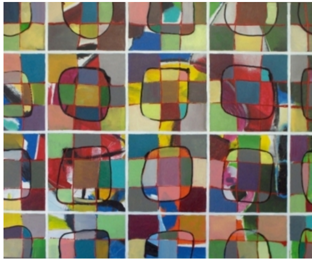
Tableau 60502, 2010 Acrylic on canvas, 60 x 50