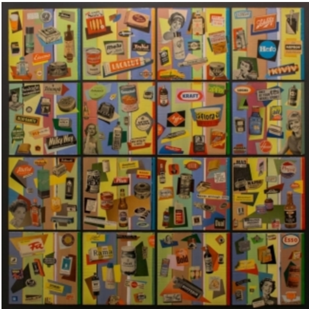
ARTvertising 1, 2015 Acryl/collage op paneel, 100 x 100