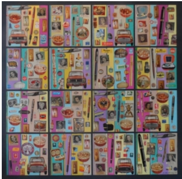
ARTvertising 3, 2015 Acryl/collage op paneel, 100 x 100