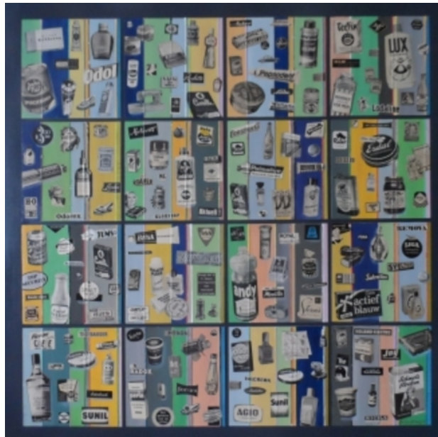
ARTvertising 2, 2015 Acryl/collage op paneel, 100 x 100