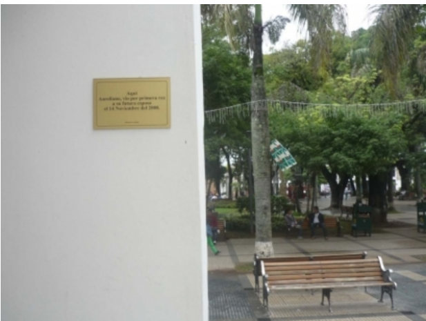
En este lugar, 2008 installatie, 12x