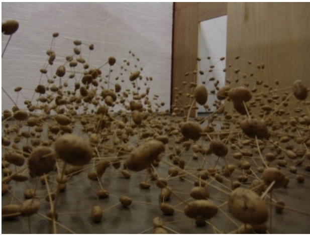
univers, 2006 instalatie, variabel