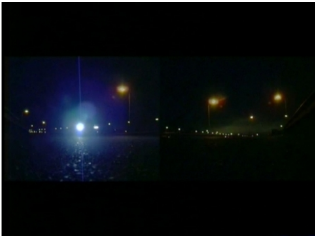
A4, 2007 video, scherm