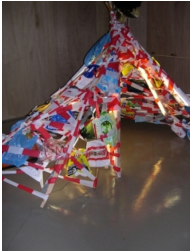
shelter, 2006 instalatie, div