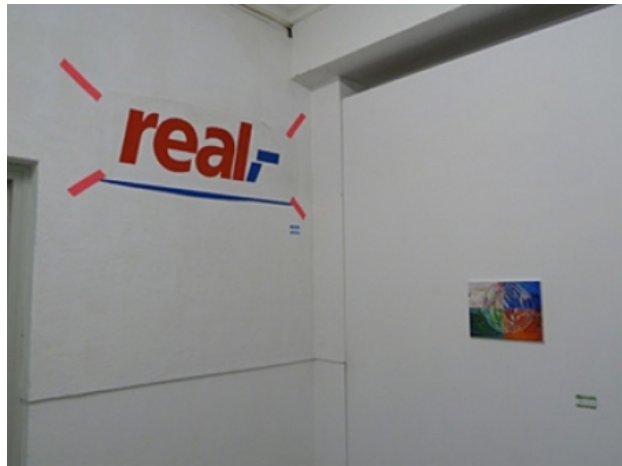
real,-, 2011 installatie, 150 x 60 ong