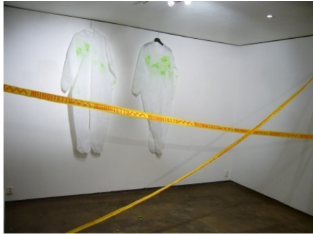
SnS Claim responsibility, 2008 installatie, div