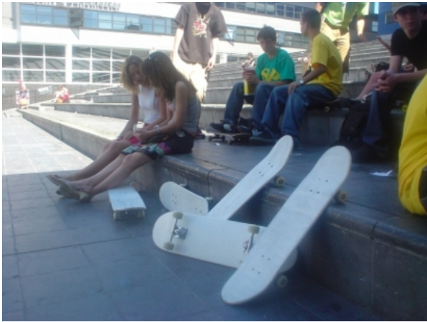
witte skateboards, 2005 interventie, 15x