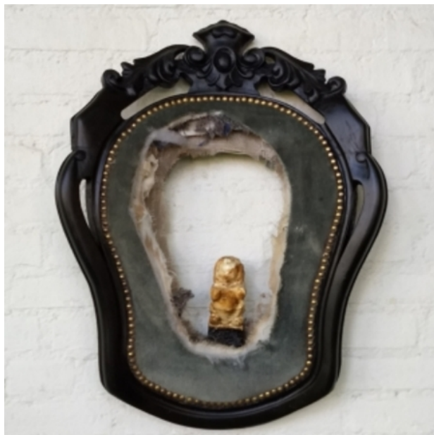
Sublimation of Perception | Coronate9, 2017 Gemengd, 40x60x8 cm