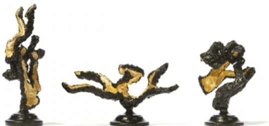
Soil of Ardour | Bright Dusk - Gold M1,2, 2013 Gemengd, p/s +/- 30x30x30 cm