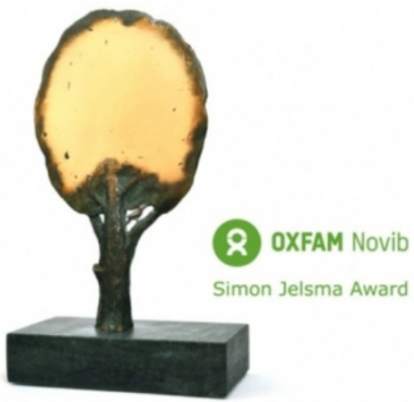
Oxfam Novib Simon Jelsma Award, 2014 Brons, 12x24x6 cm