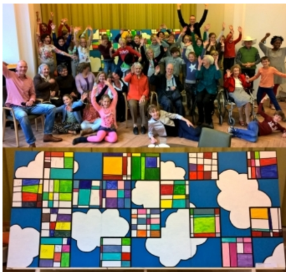
www.dekunstschool.com , 2015 Gemengd, 270x120