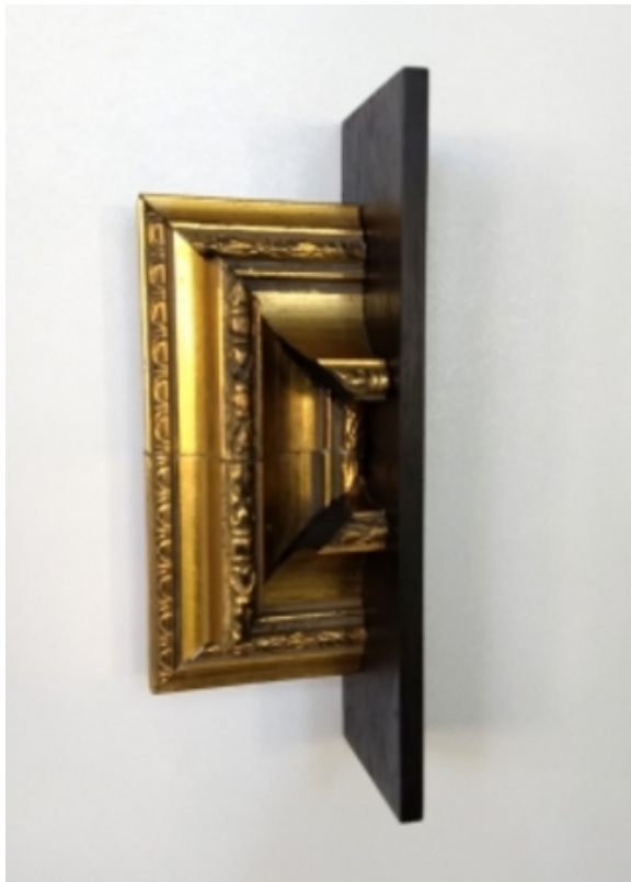
Sublimation of Perception | Coronate14, 2017 Gemengd, 8x15x4 cm