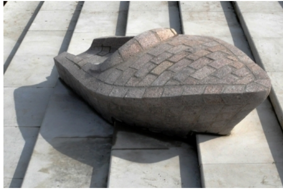
Speedboat Z414, 2014 Gemengd [Granito], 335x135x85