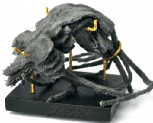
Cupidity, 2016 Gemengd, 7x7x7 cm