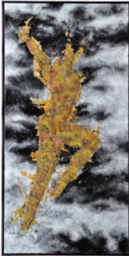
La Double Vita - High, 2013 Gemengd, 125x249x5 cm