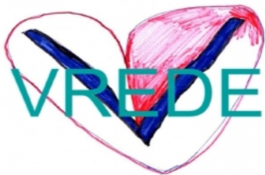
www.vredevanhetkind.nl , 2016 Gemengd, film