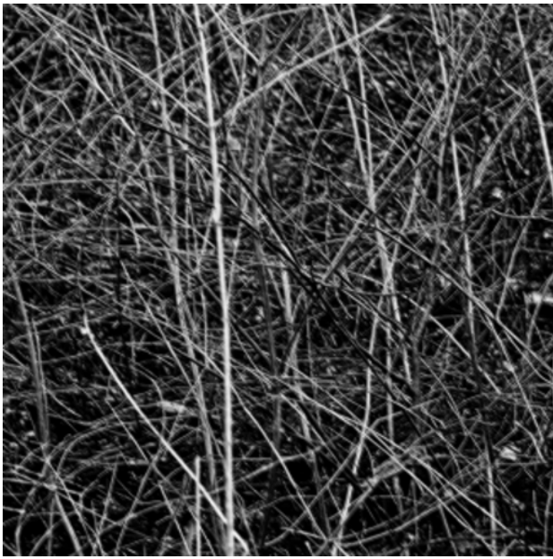
, 2016 print on zink, 100x100