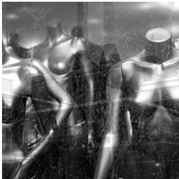
Himmel über Berlin, 2016 print on zink, 100x100