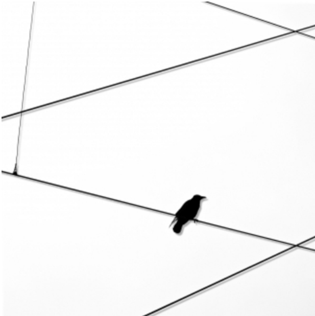
, 2015 fotoprint/acryl, 23x23