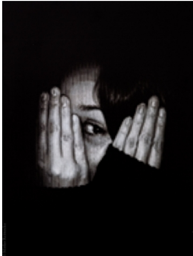
, 2011 print op zink, 30x40