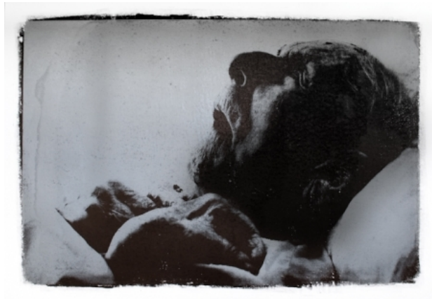
, 2008 zeefdruk met zilverpigment op houtdruk, 70x100