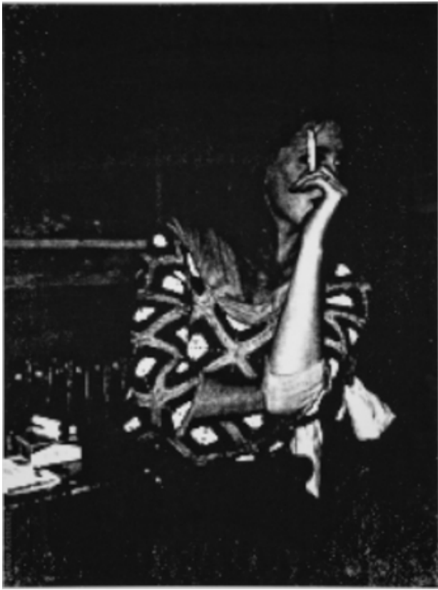
, 2010 zeefdruk, 70x100