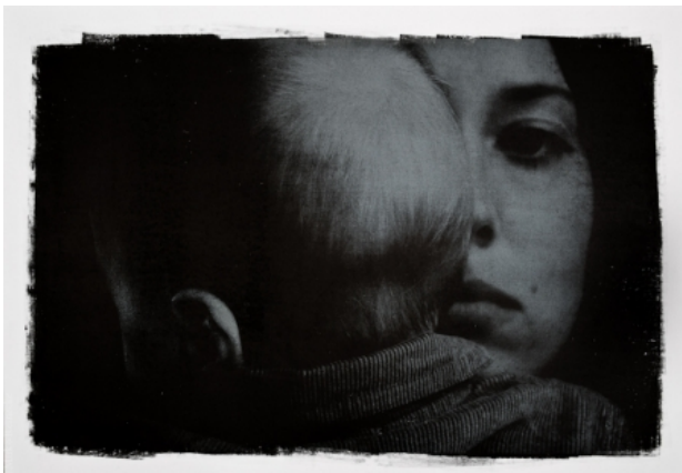
, 2008 zeefdruk met zilverpigment op houtdruk, 70x100