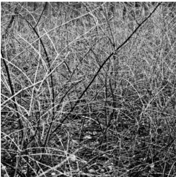
, 2017 print op zink, 100x100