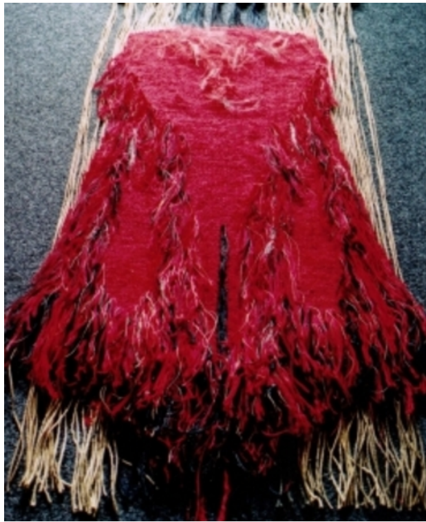
Vormweven, 2008 Linnenbinding en Ryaknoop