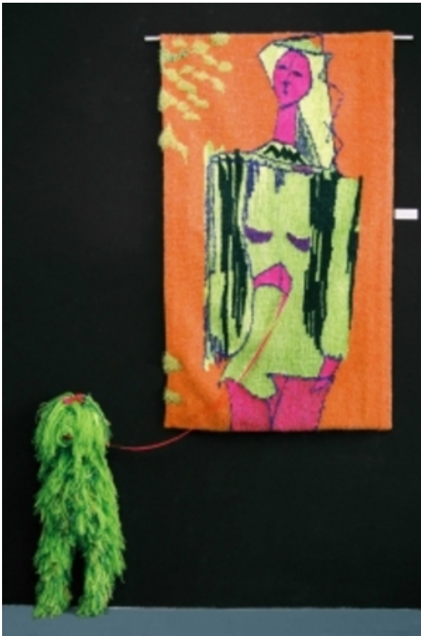
"Alter-ego", 2007 figuratief geweven, 80 x 130 cm