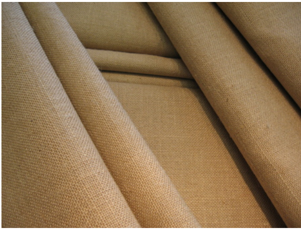
Eenvoud, 2019 Linnenbinding, 170 x 260 cm