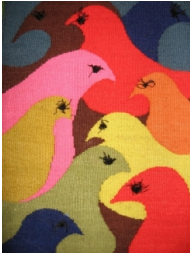
Birdwatching, 2009 Figuratief geweven, 120 x 150 cm