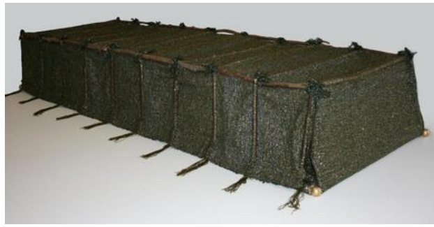
Corridor, 2018 Linnenbinding, 60 x 200