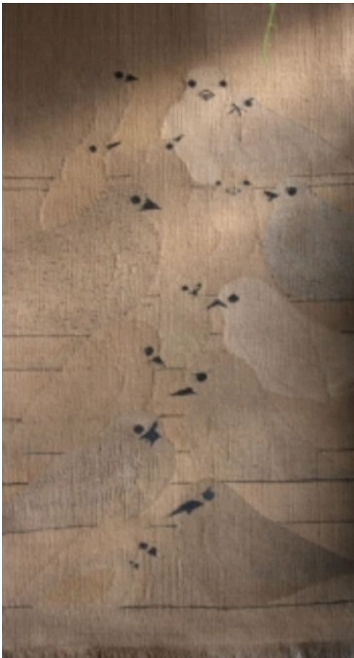
"Twitteren", 2011 Figuratief geweven van sisaltouw vervaar, 106 x 225