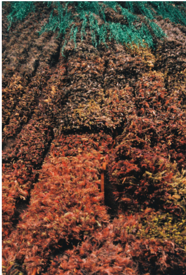
Oerboomstam, 2012 figuratief geweven, 205 x 305 cm