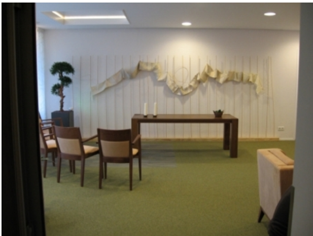
"De Levensweg", 2013 Handgeweven, 200 x 500