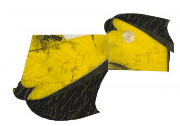
No. 6067, 2021 Lijnets, wildbijting, vernis-mou, zaging, hoogdruk, bladgoud, 25 x 16 cm