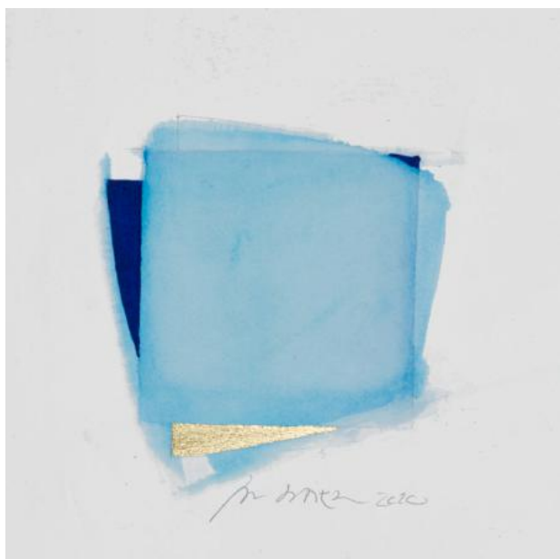
No. 6062, 2021