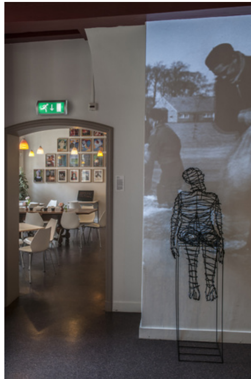
'Zittende Mens en de Man', 2018 Beeld en video, 185x50x65 en beeld van Polygoonjournaal februari 1953)