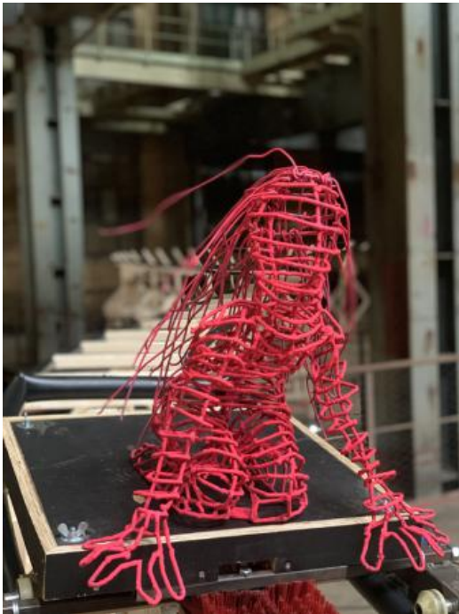
Vrouw op Handen en knieën en wapperende haren, 2020 5 mm staal met coating, 50x50x40