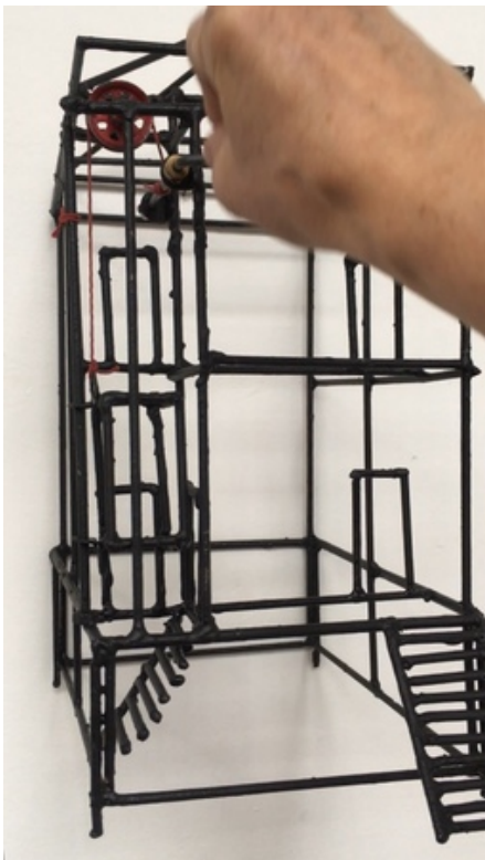
Huis met Lift, 2018