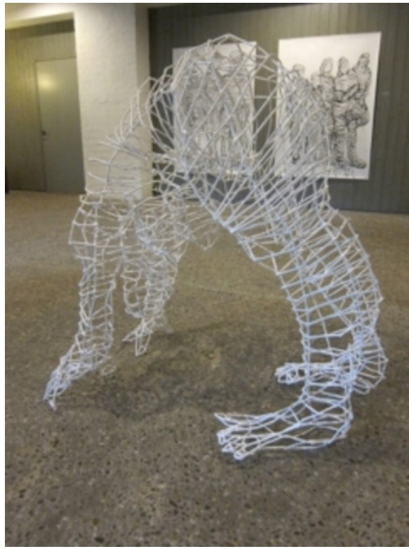
'Staande Vrouw', 2017 5 mm staal, afm.130x75x150