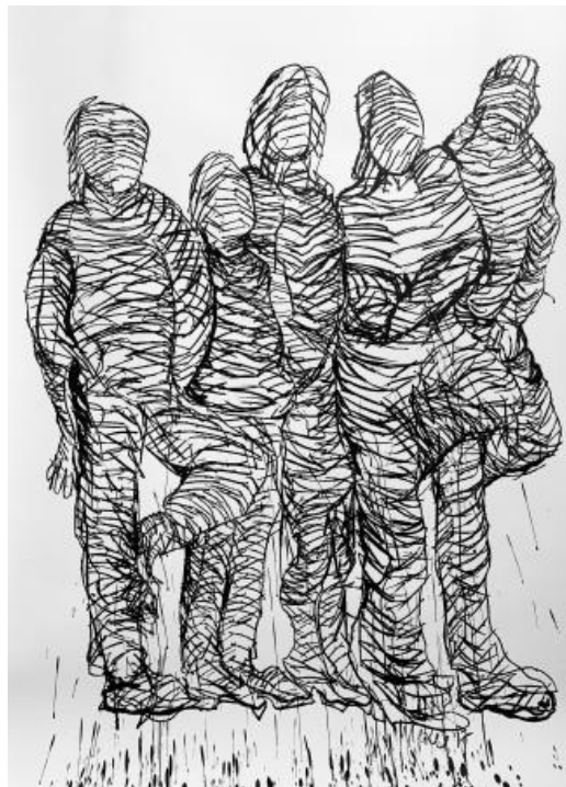
de Groep, 2018 Oost Indische Inkt met eigen inktrol-pen, 150 X 200 cm.