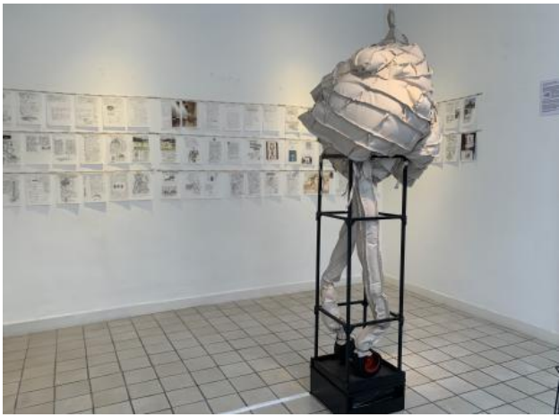
'Me and Boltanski on Teshima', 2025 Waterafstotende stof, blower 220V op rubber tegel, 12 mm. houten frame, kastje met MP-3 player met mijn hartslag, geluidsbox en mini-versterker. Dun houten frame en rubberen hart dat volblaast met een blower. Uit de speaker klinkt zacht mijn hartslag.. (afm. 175 x 75 x 75 cm)