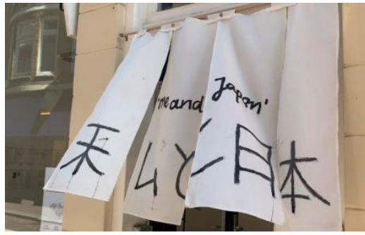
Me and Japan, 2025 Oost Indische inkt op doek, 80X90 cm