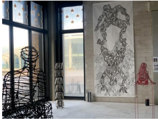
'Het universum is een ondeelbaar dynamisch geheel' (Einstein), 2024 Oost Indische Inkt met eigen inktrol-pen, afm. 1.50 X 3,50