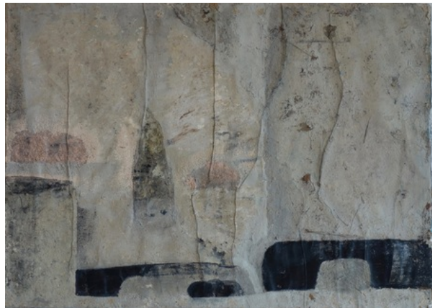
Wadi Rum, 2018 gemengde techniek