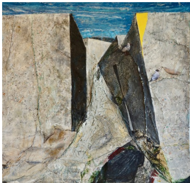
Birds on the Rocks, 2018 gemengde techniek