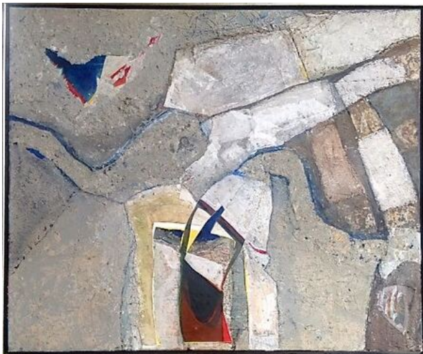
Rio Seco, 2018 gemengde technieken