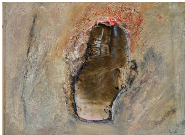
Triggerfinger 1, 2019