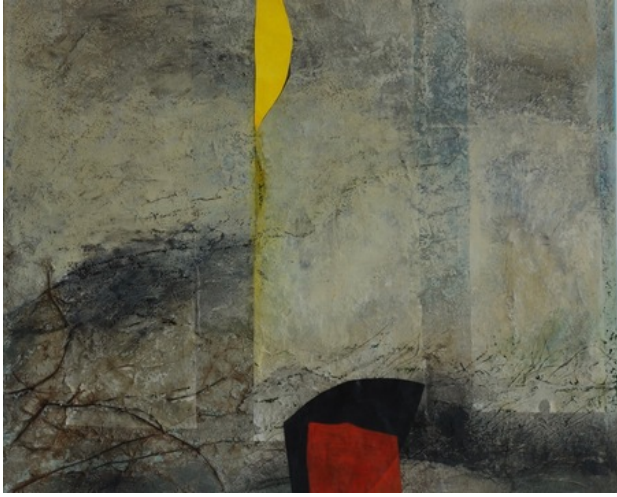
De Dageraad, 2018