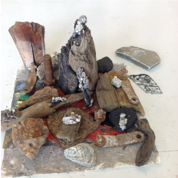
Verlaten Stad, 2020 hout, ijzer, vezel