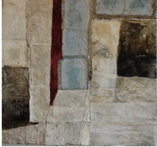
Stairway to Heaven, 2018