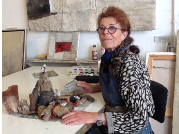
Aan het werk, 2020