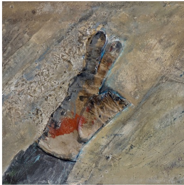
Triggerfinger 3, 2019 gemengde techniek