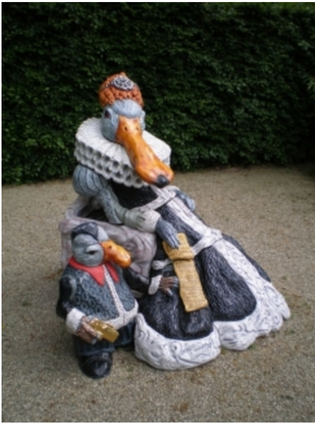
Dame en haar dwerg, 2008 keramiek, ca. 175 cm hoog