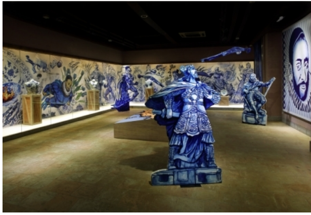
The Blue Revolution, 400 years exchange, 2014 Keramiek, poselein, diverse materialen, nvt