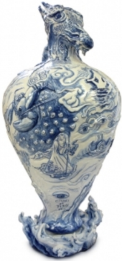
Dragons and Lions, 2015 keramiek, Hoogte 110 cm