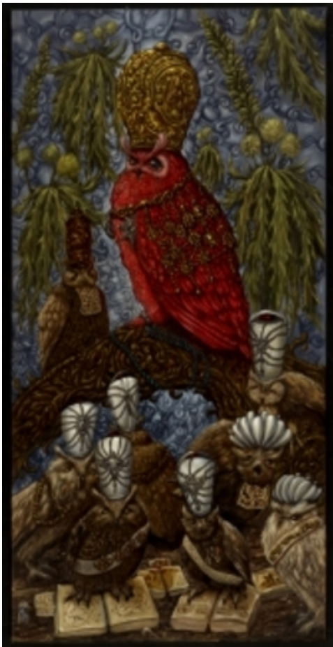
Koning Bubo bubo De Rode en zijn adviseu, 2011 Olieverf op doek, 120 x 60 cm