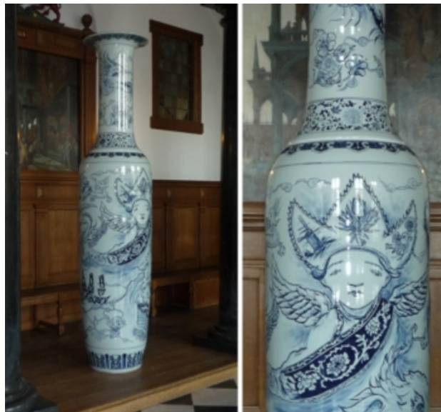
Perpetua Porseline, 2010 Porselein, 350 cm hoog