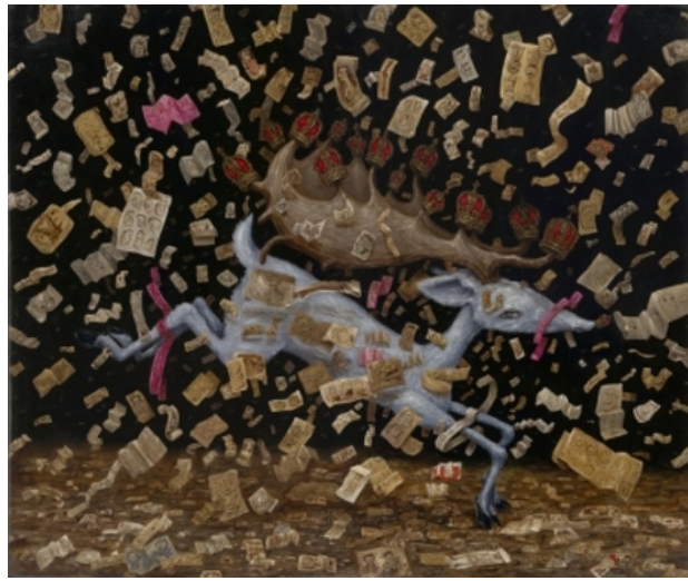
De legende van het hert, 2010 Olieverf op doek, 130 x 110 cm