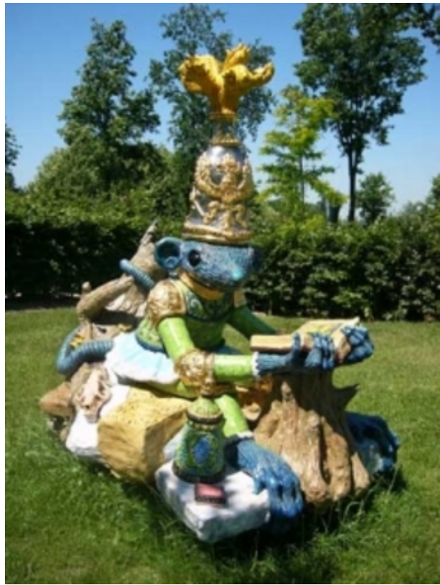
Afterwar Delight, 2006 Keramiek, 190 cm hoog