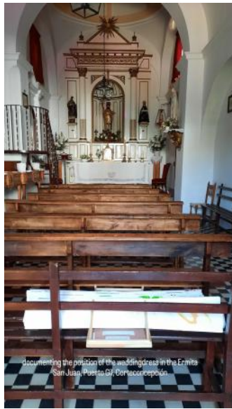
el documento espera para performar como vestido, 2025 zie beschrijving, zie beschrijving