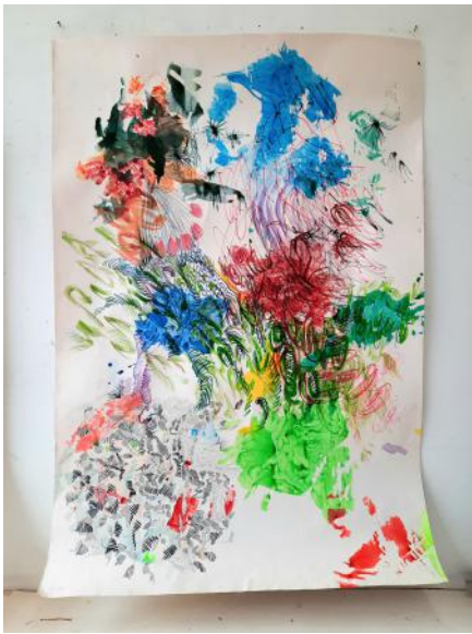
Zoekogen, 2025 diverse teken en schilder materialen, 181x124cm