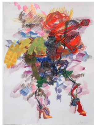
Sois belle et tais-toi (waiting for the other context), 2024 Gouache, kleurpotlood, multicolour potlood, potlood, marker op aquarelpapier, . 77x56,5cm