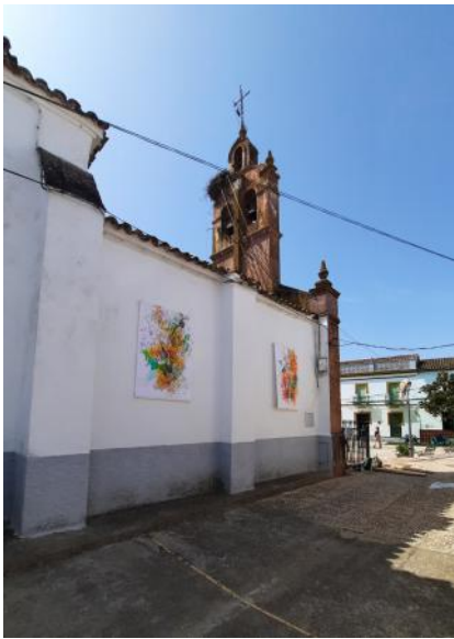
deel van de tentoonstelling Brota el Pueblo, 2025 acryl, marker, potlood op stucloper, 178x122 cm