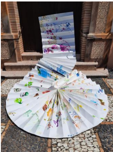
werktitel: The Dress, 2025 variatie aan teken-en schildertechnieken, collage van droogbloem, 1x100 m