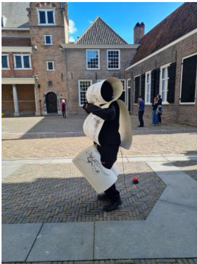
Walk, listen and draw, 2025 performance