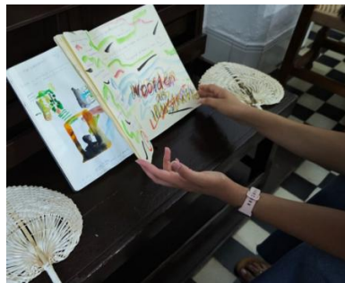
Het Vijfde Boek, 2025 fountain penn, and div. drawing materials, 30,5x22cm size book