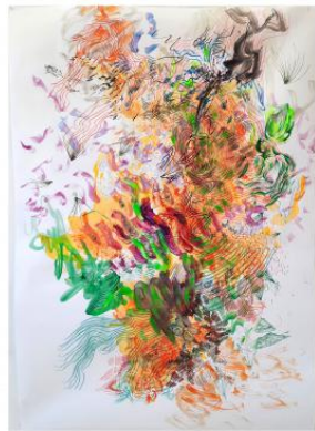
moving inside the dress, 2025 kleurpotlood, acryl, marker op stucloper, 178x122cm