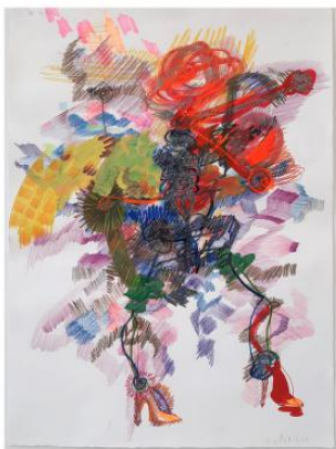
Sois belle et tais-toi (waiting for the other context), 2024 Gouache, kleurpotlood, multicolour potlood, potlood, marker op aquarelpapier. . 77x56,5cm