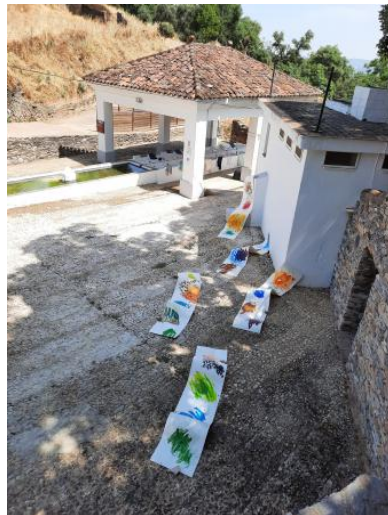
Weaving sounds and signs into moving traces, 2025 acrylic, marker and local soil on cardboard, 5x 280x55cm