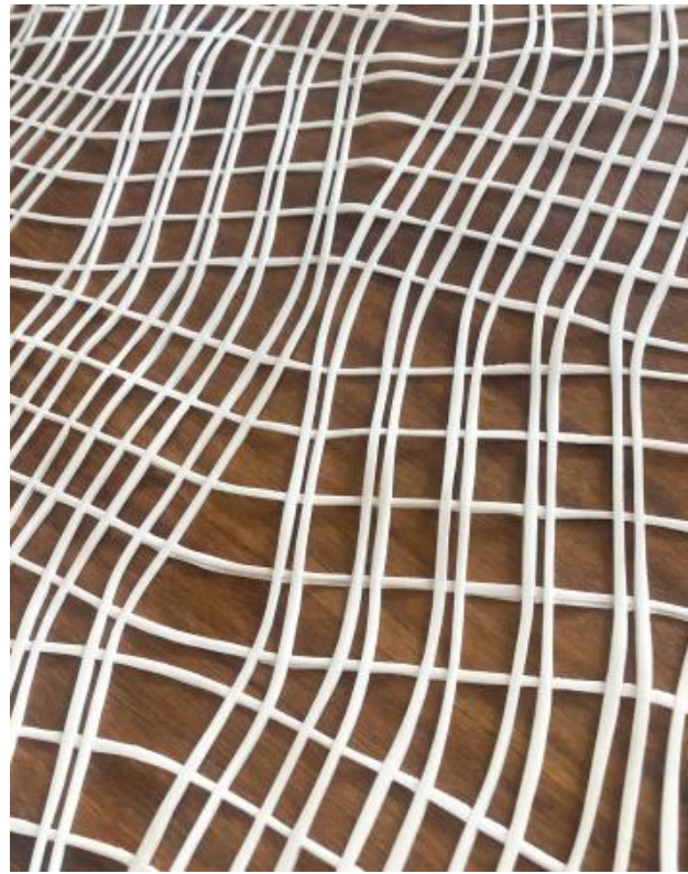
3P-07, 2018 3D print, 2015