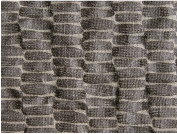
Linen print, 2015 Pigmentdruk en krimpdruk, 2015