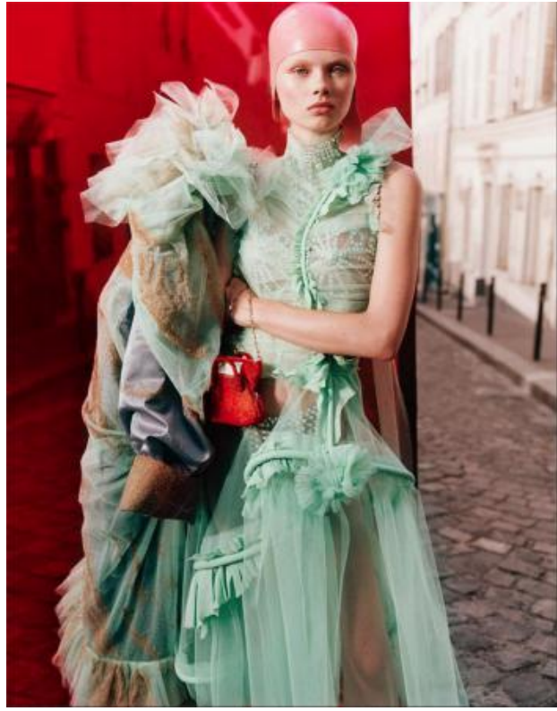
Flockprint voor Maison Margiela, 2022 flockprint, 2018