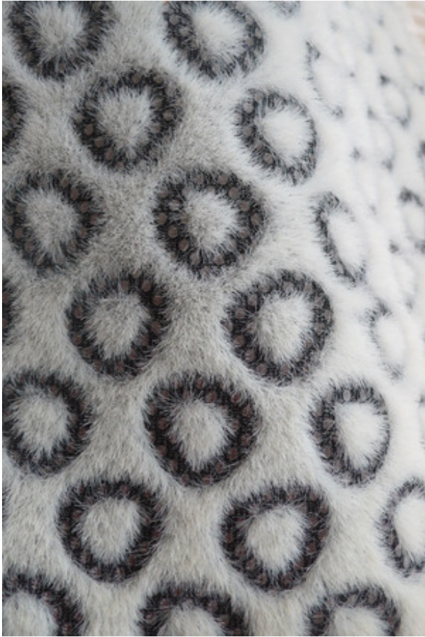
Flock op spacer, 2015 Flockdruk op technisch breisel, 2014