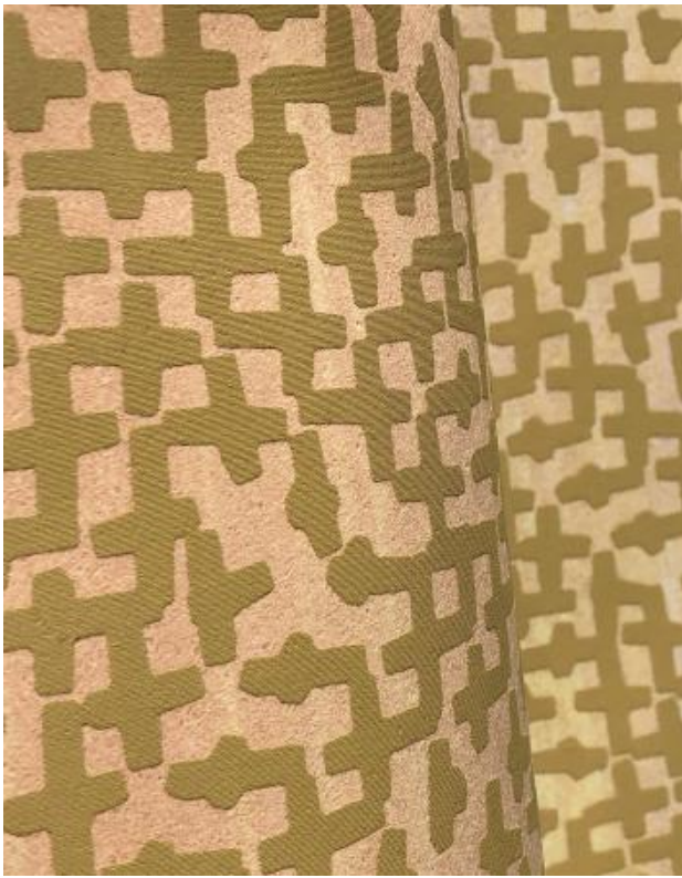
Ei-144, 2019 Schuimdruk, 2017