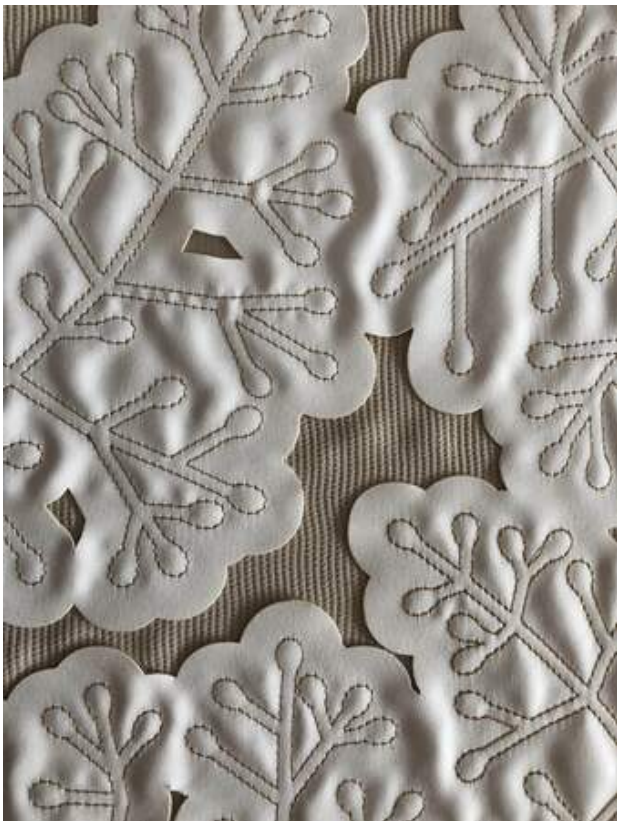
Lasergesneden borduursel, 2017 Lasergesneden borduursel, 2015