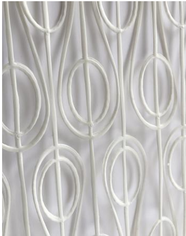
3P-11, 2019 3D print, 2016