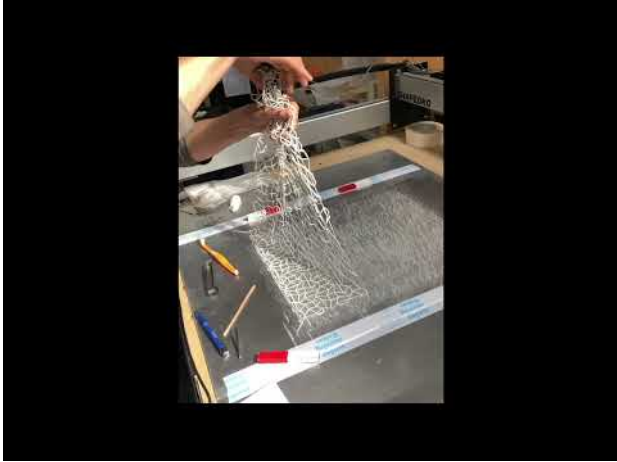
3P printing April 2022 35 sec