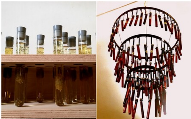
Alchemistisch carroussel, 2018 installatie, variabel