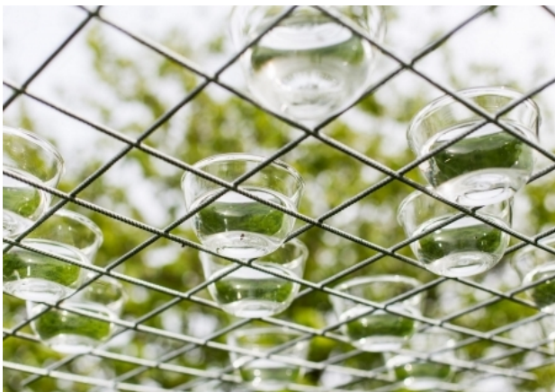
Hangend water, 2015 installatie/lenzenproject, variabel