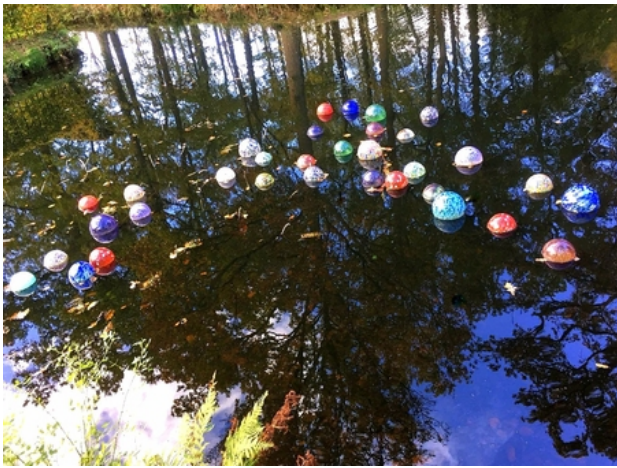
Getijdenbollen, 2019 drijvende installatie, variabel