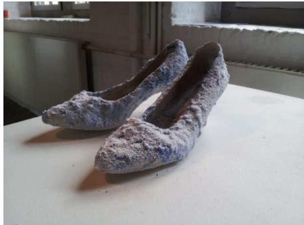
Moderne fossielen (serie), 2024 Stof, zeezout, tijd, 30x40x20