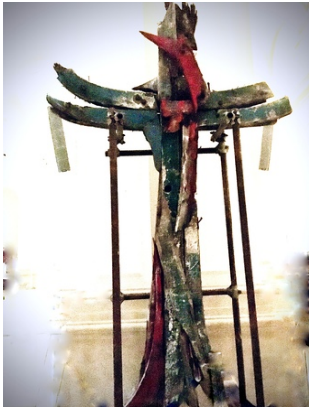
Phoenix, 2019 installatie, h. 340