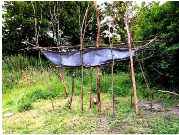
Gestrand, 2019 installatie: gesnoeide wilgen, zeildoek, 800x135x650