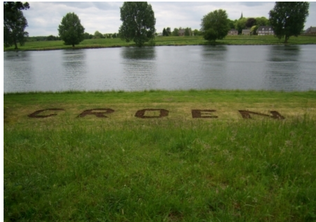
GROEN, 2016 land art project, 800x220.