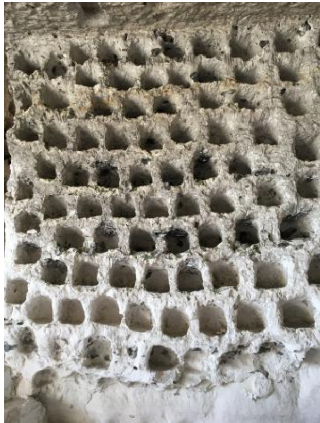
Where the doves cry, 2022 gem. techniek, variabel